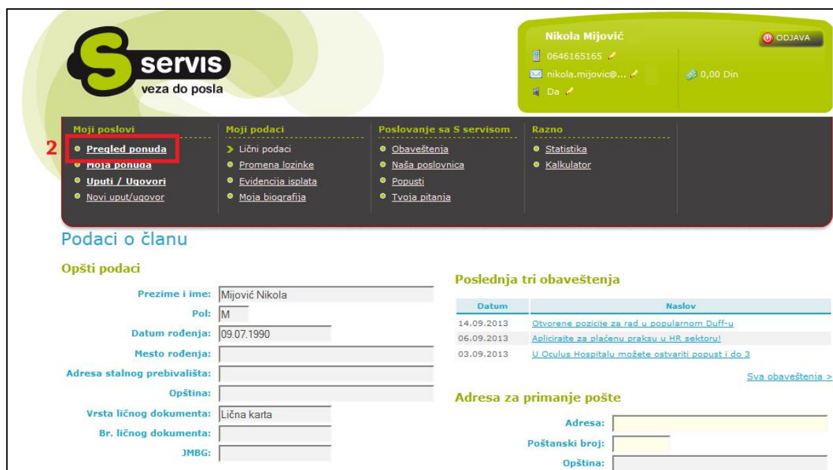
Slika 2. Pregled ponuda

U okviru Vašeg korisničkog profila odaberite sekciju Pregled ponuda (Slika 2).