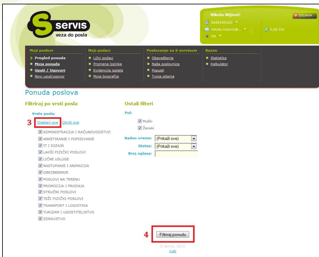
Slika 3. Filtriranje aktuelne ponude poslova

Filtrirajte ponudu na osnovu kriterijuma koji Vas zanimaju. Uvek možete pogledati celokupnu ponudu poslova odabirom opcije Odaberi sve , a nakon toga kliknite na Filtriraj ponudu (Slika 3).